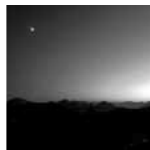
Nacht am Breitenberg