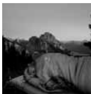
Biwakieren am Breitenberg

Mit ungetrübtem Blick auf die Milchstraße einschlafen und inmitten der Allgäuer Bergwelt mit den ersten Sonnenstrahlen wieder aufwachen: Auf dem Breitenberg in Pfronten verbringen Naturfreunde jeden Monat zwischen Juni und September 2021 auf rund 2.000 Metern „Eine Nacht unter Sternen“ im Schlafsack.