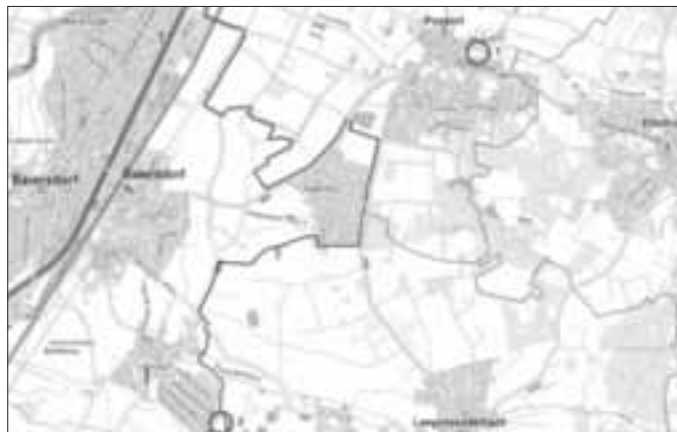
Übersichtslageplan mit Bauvorhaben (Ziffer 1) und Ausgleichsfläche (Ziffer 2)

Die Lage des Bereiches der Einbeziehungssatzung sowie der zugeordneten Ausgleichsfläche bei Igelsdorf kann dem nachfolgenden Übersichtslageplan entnommen werden.